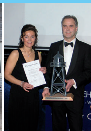
Verleihung des Unternehmerpreises 2009

Orthopädietechnik Orthopädienschuhtechnik Rehabilitationstechnik Kinderorthopädie / -rehabilitation Kompressionsbestrumpfung Brustprothetik Sitzschalenversorgung Homecare